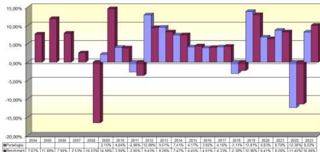
Tav. 4 – Rendimenti netti annui (valori percentuali)