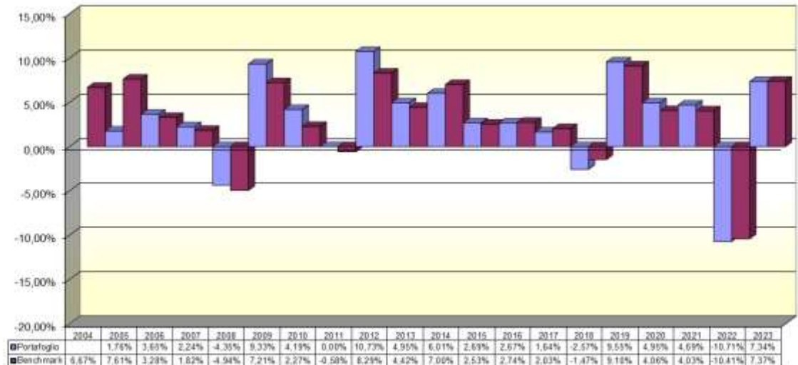
Tav. 4 – Rendimenti netti annui (valori percentuali)