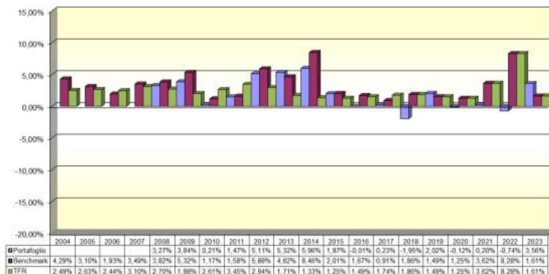
Tav. 4 – Rendimenti netti annui (valori percentuali)

Benchmark: a partire dal 1° gennaio 2018, la gestione del comparto adotta una strategia non a benchmark; da allora viene preso a riferimento come benchmark il tasso di rivalutazione del TFR.